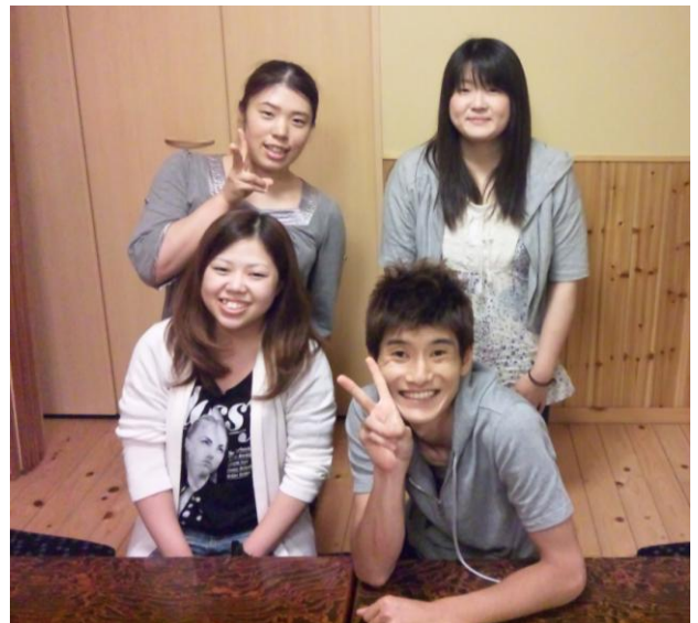
青年部結成に集まったみんなで打上げ！楽しいこと企画しよう！

7 月 15 日に行った新人オリエンテーションの懇親会の中で、突然に若い組合員が立ち上がり「今の執行部がいなくなるとどうなるのか？将来が心配だ。でも、組合のことは良く分からないから先に楽しい事を企画して、少しずつ組合の事を覚えよう！」と青年部結成の話がトントン拍子に決まりました。これからの活躍や成長が楽しみです。