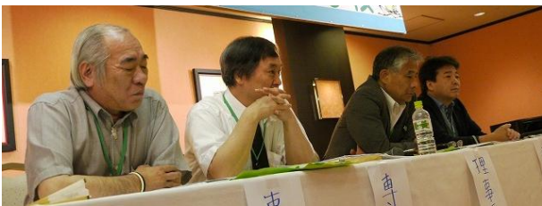
執行部が経営側で交渉

月 8 日の夜勤協定が守られていない問題で看護部長が「若い人からやりたいと声がある」という発言に「やりたいからやらせているのでは協定を守っていない」とすかさず突っ込みを入れ、人員不足の現状をどう改めるのかに「努力している」とだけの回答に「努力だけではダメだ」と強く追及。回答に窮した看護部長から泣き言が漏れる一幕がありました。年次有給休暇の取得など追及を重ねました。今回短時間の模擬団交で有ったため、魅力ある職場にしていくため、引き続き協議をしていくことを約束して終了となりました。