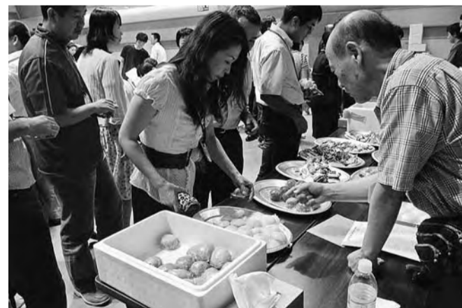
手づくりのおまんじゅう等で神厚労からのおもてなし

三重からは、定例労使協議会等による「労使協働」の強化に向けた取組みを報告。福島では、事業計画からの大幅乖離の下での厳しい賃金闘争とともに、職場の労働環境問題を労使間の共通認識とするために、ユニオン協定見直し、組織強化に取り組みしていることが報告されました。