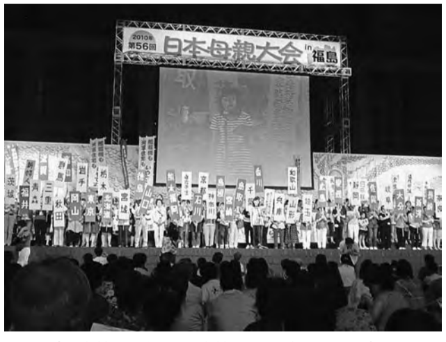
全国各地から集まった女性たちで熱気あふれる会場

戦争することで特に女性には負のことが背負わされることが多くなる。戦争からは悲劇しか生まれない。日本は税金や社会保障の使い方問題がある、世界一の金貸し大国と先生は述べていました。もっと必要な肝心なところにお金を使わなければならない。