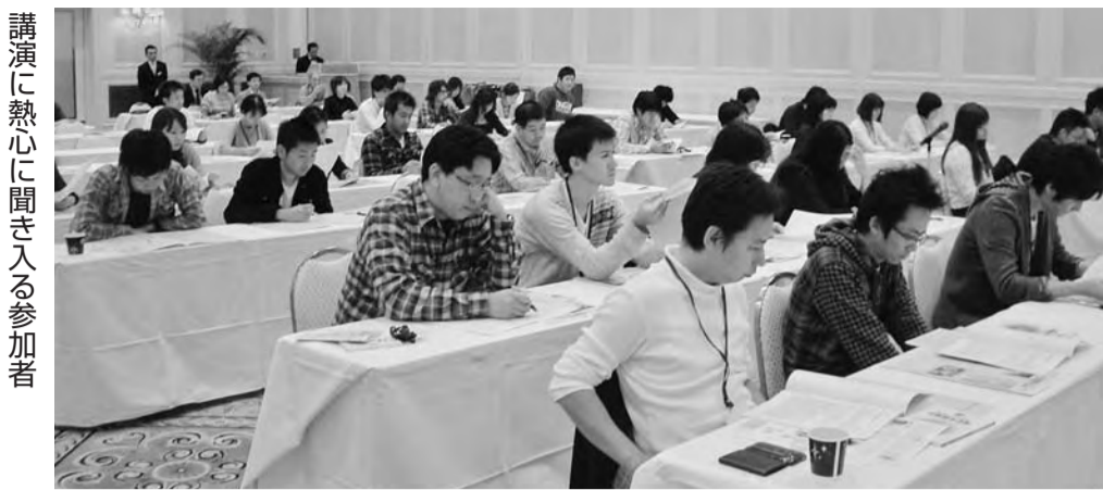
講演に熱心に聞き入る参加者

「自分たちの利益のために手段を選ばない怖い存在」から「相談すれば何とかしてくれる、助けしてくれる存在」へと変わりました。建設労働者の組合では「組合に入りませんか？」とパンフレット持っていきと逃げていった状況が09年の春は「パンフレットを下さい」と自ら取りに来てもらえるようになっています。