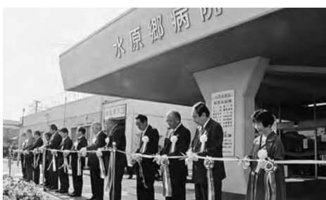
新潟・新生 水原郷病院の開院式

公設民営での指定管理者制度(※)による運営を受け、10月1日より、厚生連水原郷病院として再スタートさせると同時に、新厚労阿賀野支部を立ち上げました。