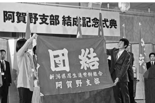
新厚労阿賀野支部に組合旗を授与

約250名の組合員が増え、定期大会の日に行われた支部結成記念式典も100名を越える支部組合員の参加で盛大に行われました。