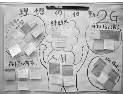
第1分科会Cでの「理想の夜勤」について

第3Gでは、「子どもに誇れるナースであるためには」とナースになりたい人を増やす努力が大事で、子どもへの職場体験、プチナース記念撮影を積極的に実施していく。また福利厚生・潜在ナース掘り起こし・長期休暇の充実・