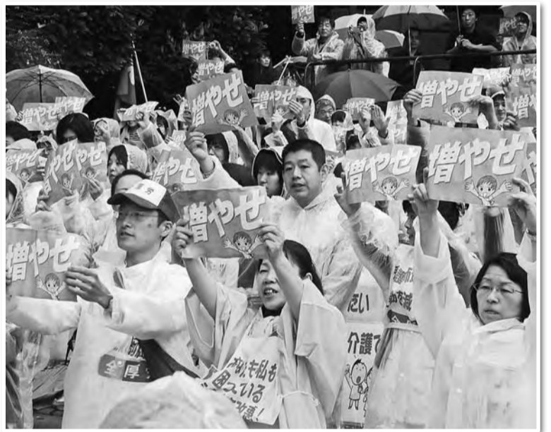
日比谷野音にて看護師増やせ!の増やせコール

銀座へ向けてのパレードでは、沿道からの応援もチラホラと。全厚労特製のプラカードや埼玉厚労が持参した手製のPATCHワーク横断幕が、マスコミの注目も浴び、TVカメラの取材も受けていました(報道されたのは定かではありません。ご存知の方がいられたら全厚労本部までご一報を)。