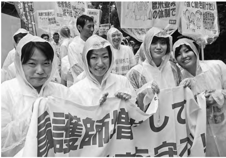
パレードの先頭に立つ静厚労の仲間たち