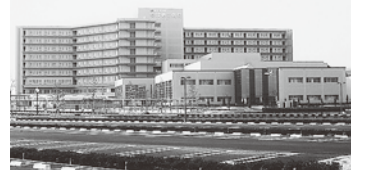
新幹線から分かる存在感

人口17万人を超える安城市をはじめとした西三河南部医療圏(108万人)最大の地域中核病院。病床数723床に1306人の職員が働いています。「あそこに行かねば生きていけん」と冗談交じりに話されるほど親しまれています。