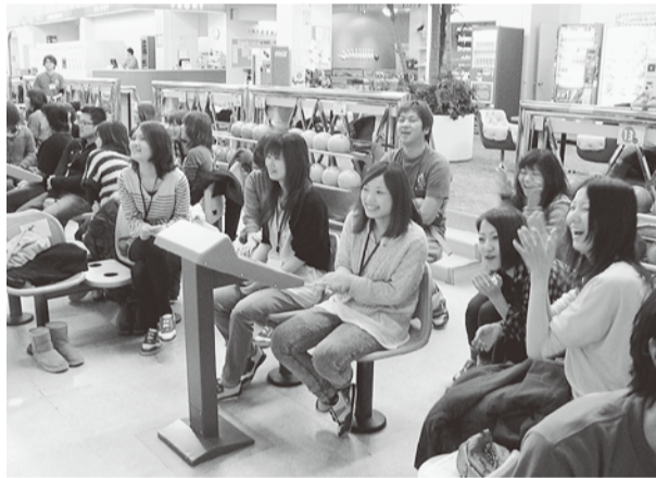
班別ボーリングで初対面でも打ち解けた

3月5～6 日、新発田市・ 月岡温泉「泉 慶」で13支部 約60名が参加 して、新厚労 青年部冬の交 流会を開催し ました。