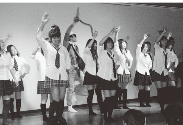
AKB48に扮装して会場を盛り上げた