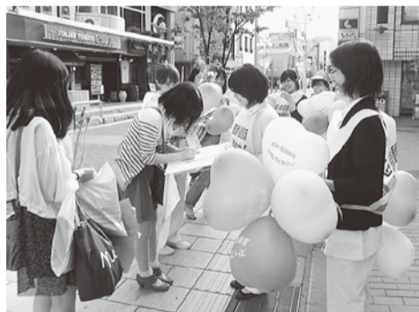
県看護集会で署名に取り組む (長厚労安曇支部)

5月の「看護週間」に、全国各地でナースウェーブが行われています。5月8日、長野では看護集會が開催され、県看護協会の会長も挨拶、白衣デモ、署名宣伝が行われました。 同日、茨城では高校生20名も参加しての集會で、震災経験を活かそうとの報告や宣言がなされました。