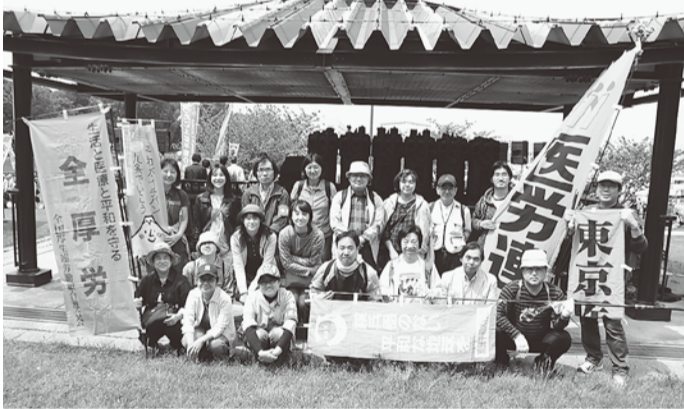
在京の医療労組組合の仲間たち

静岡では県看護連絡会の取り組みとして、120名が参加。佐々木司先生の講演、市内繁華街での署名行動、県議会要請を実施。山口のナースウェーブに