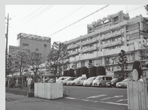
協同の名に誇りあり

許可病床は900床、診療科は22科となり茨城県内最大の医療機関です。施設特徴としては、救命救急センター、県地域がんセンター、総合周産期母子医療センターなどを併設し、県地域災害拠点病院、県小児救急医療拠点病院など数多くの指定を受けており、医師数約180名を数え、小児科医も20名を抱える病院です。 許可病床は900床、診療科は22科となり茨城県内最大の医療機関です。施設特徴としては、救命救急センター、県地域がんセンター、総合周産期母子医療センターなどを併設し、県地域災害拠点病院、県小児救急医療拠点病院など数多くの指定を受けており、医師数約180名を数え、小児科医も20名を抱える病院です。