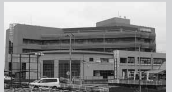
JAの施設もあり地域の中心地です

2002年に移転新築し、高知県東部の地域医療を担う、病床数178床の医療機関。JA組合員をはじめ地域の皆さんに選ばれる地域密着型の中核病院。介護老人保健施設「JAいなほ」がJA高知病院に近接して開設されている。