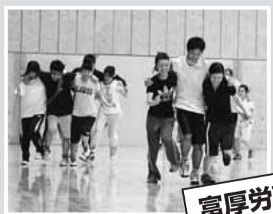
富厚労高岡病院支部

去る6月11日(土)、2年に1度の富厚労高岡病院支部「第13回院内大運動会」を開催しました!! 組合員およびその家族280名超の多数の参加者が集まりました。赤・白・青・黄の4団に分かれ、14種目の競技に選手たちは目まぐるしく運動不足を吹き飛ばすかのように笑顔を見せ、注目の男女混合リレーでは年少から20代男子までを男女・世代ごとにバトンを繋ぎアンカーがゴールするまで目が離せないドキドキ・ハラハラの大接戦となりました。また恒例の富厚労執行部役員が各団の女性たちからメイクを施され看護師姿に女装する競技では、執行部役員の普段の姿からは想像もできない女(男?)の色気を存分に披露しました。