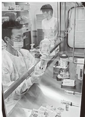
抗がん剤のミキシングを行う棚合員さん

「調剤、医薬品の供給その他薬事衛生をつかさどることによって、公衆衛生の向上及び増進に寄与し、もって国民の健康な生活を確保する」高度専門職業人です（薬剤師法第一条）。現在日本でこの資格を得るには6年制の薬学部を卒業後、薬剤師国家試験に合格しなければなりません。 医師、歯科医師、獣医師が作成した処方箋をもとに調剤をすることができます。