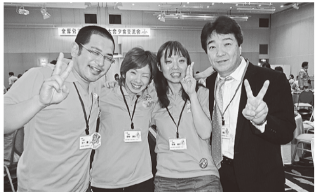
揃いのポロシャツで大会を支えた岐阜のスタッフたち。

福島は、震災後の自粛ムードを乗り越え、福島の医療機関を守るため、元気に報告がありました。