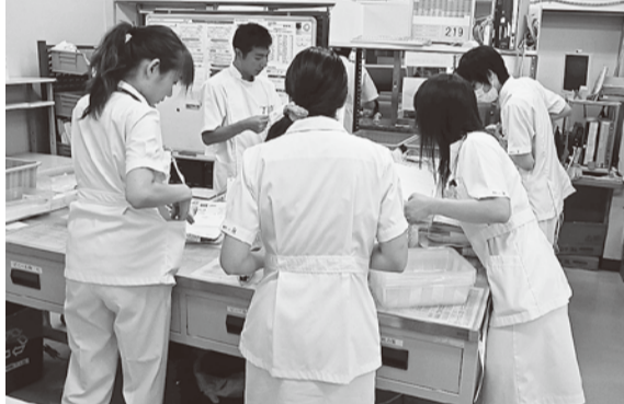
調剤部でテキパキと働くスタッフたち

システム化された調剤 調剤はシステム化されて、エラーのないように工夫されています。処方箋はすべてバーコード処理されて、薬剤名も複数の規格があるものについては、用量を間違えないように、標準量より少ない薬剤は「青色」、多い量のものには「赤色」で記載されていて、チェックしやすくなっています。 この時期（8月末）の外來患者は、1日900名程で農繁期である夏、秋にかけては少なく、冬に入ると1200名程にまで増えます。 質と安全の向上めざし 北海道厚生連としても、職能別研修、職種別研修は充実していて、年数回、札幌まで出かけてリーダー育成や技能向上を目指しています。 薬剤師会の研修・学会にも積極的に対応していますし、遠紋地区病院薬剤師会としても年3回の研修会や講演会を企画しています。 がん専門薬剤師や栄養サポート専門療法士の資格を持った薬剤師もおり、積極的に資格取得を推進しています。資格取得や維持のための研修費用は病院が負担するようにし、仕事の質の向上とモチベーション向上につながるようになっています。 また以前は病棟看護士も一部行って