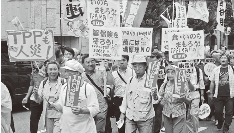
1300人が集まり医療の合理化反対・安心安全の食糧を求めて銀座パレードを行いました。