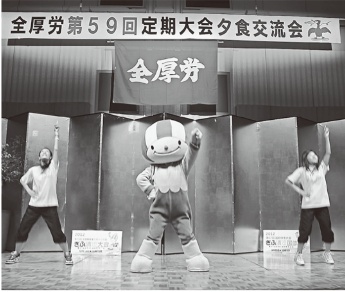
来年の岐阜清流国体のゆるキャラ・ミナモちゃんも登場

青年委員会は、2回の労働学校とコラボレーションして「模擬団交」に取り組んだこと、来年の長野で開催するK's station 成功への決意を表明しました。