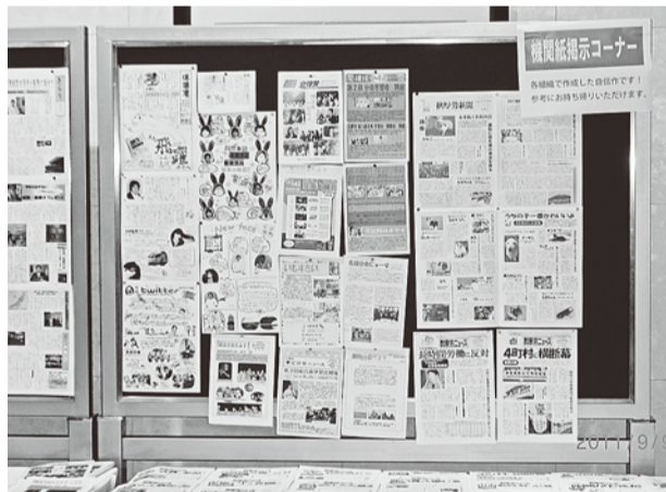
今回初めて行った「機関紙掲示コーナー」

職場の労働条件改善、地域の医療の充実めざして旺盛に活動しよう」と呼びかけました。