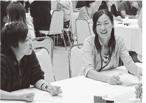
少人数でみっちり話し合えました

休暇は取れてい る、との報告も ありました。 対策としては、 人員確保を訴え、 細く長く働き続 けられるよう良 い人間関係をつ くる。仕事と家庭が両立出 来る様な環境づくり、家庭 があつての仕事、自分が元 気でないと良い医療・看護 は提供できない、という意 識をつくる。勤務間隔を12 時間あけられるように話し 合つていく、などの意見が 出されました。