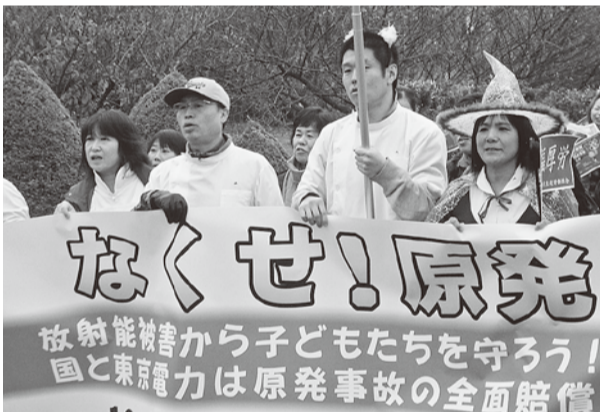
白衣やハロウィーンの衣装は目立ちました

10月30日、「なくせ! 原発」安心して住み続けられる福島を! 10・30大集会in福島」が、紅葉で徐々に色づく福島市四季