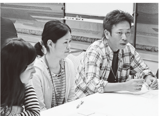
集会で得たことを現場で実践しよう