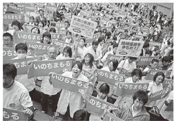
厚労省に向かって「いのちまもれ」と叫ぶ!

10月30日、「なくせ! 原発」安心して住み続けられる福島を! 10・30大集会in福島」が、紅葉で徐々に色づく福島市四季