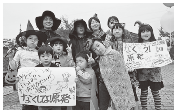
大声で訴えた福島の子もたち

坂下分会からの参加者は「双葉から逃れてきた患者さんやスタッフのみんなの体が心配だし、私たちもただ影響を受けているか不安」国や東電は責任逃れではなくキチンと向き合ってくださいました。