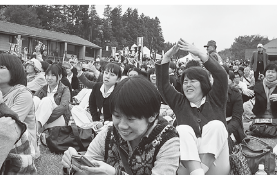
ステージからの訴えに「丸」で応える参加者

「徹底的に除染しろ!」「全面賠償当たり前」など、シュプレヒコールを行いながら周辺をパレードしました。 集会後、脱原発アピールパレードを行い「なくせ原発!」 「徹底的に除染しろ!」「全面賠償当たり前」など、シュプレヒコールを行いながら周辺をパレードしました。 集会後、脱原発アピールパレードを行い「なくせ原発!」