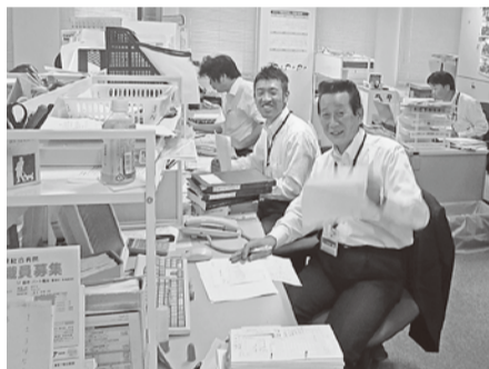
パソコンを前に 医事課の業務をこなすスタッフ

医事課は、主に日々の外来患者に対する「外来関連業務」・入院患者に対する「入院関連業務」・医療費の請求に係る「保険請求業務」などにより構成され、その他にも健康診断・人間ドック業務、労災請求業務、自賠責保険請求業務など業務範囲はかなり広く、幅広い知識と経験が必要な部署です。