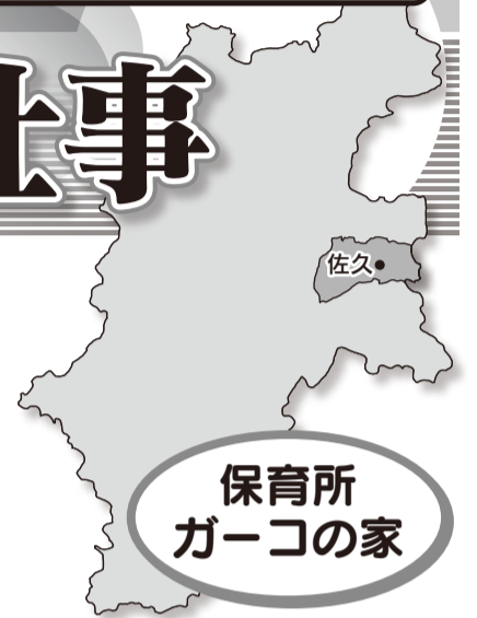
保育所 ガーコの家