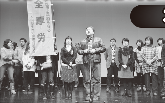
全厚労の参加者全員でステージに上がりアピール

今年のビキニデーは、昨年3月の大震災・原発事故を受けて、世界的に動き始めた「核兵器廃絶・全面禁止」の課題と、脱原発・自然エネルギーへの転換をめざす運動が一体になって開かれたのが特徴でした。全厚労からは、23名が参加、福厚労からも青年部2名が来てくれました。 2010年5月、国連で189カ国が参加して核不拡散条約(NPT)再検討会議が行われ、「核兵器のない世界の平和と安全を達成」することを決めました。そして昨年12月の国連総会では、ニュージーランドやメキシコなどの非核7カ国が提案した新アジェンダ連合の「核兵器のない世界をめざす」提案が、日本を含む賛成169カ国、反対6、棄権6の圧倒的な多数で採択されるなど、核兵器廃絶の声が世界のゆるぎない流れとなっています。国連総会議場の入り口には、原水協が集