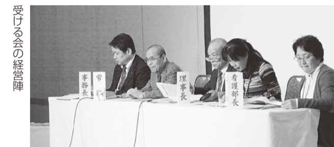
受ける会の経営陣