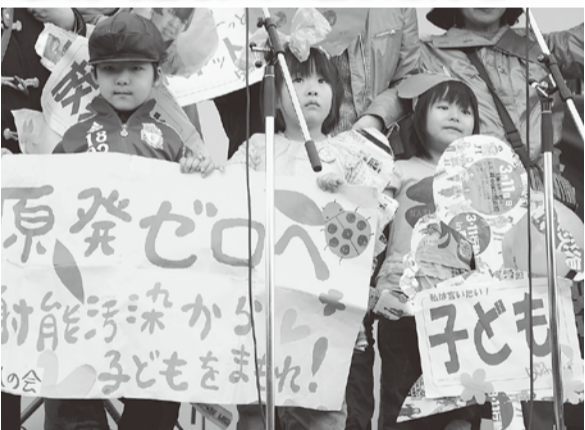
3・11 東京・井の頭公園に8000人「原発ゼロ」へ、子どもたちが訴え