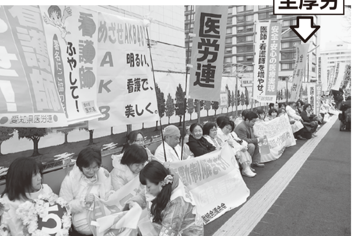
冷たい雨の降る中、白衣で座り込む医療労働者の仲間たち

2日目の国会前座り込みは、前日の暖かさから一転、寒風と小雨がぱらつく中での行動になりました。200名の白衣の行動隊が寒さを堪えながら、国会に向けてリレートーク。被災地3県を始め、厳しい現場実態を訴えました。