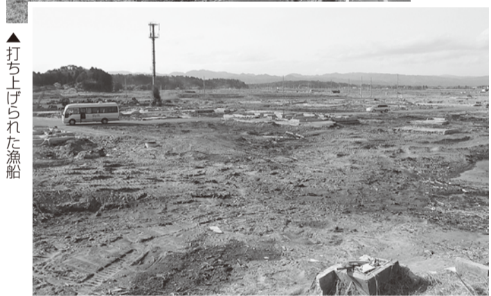
▲打ち上げられた漁船

うとしていますが、今もなお国道の横には津波で流された漁船が撤去されないまま残されていたり、処理できないままの山積みのがれきや営業していない多くの店舗等、実際の目に映った光景は復興というにはまだまだ程遠い光景でした。津波の被害を受けた地域を訪れた時、実際に自分の目で見ると、津波で流された漁船が津波で流された地区を説明とともに案内していただきました。震災から1年が経過しよ