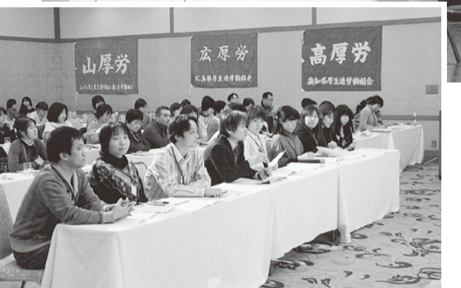
攻める徳厚労の執行部