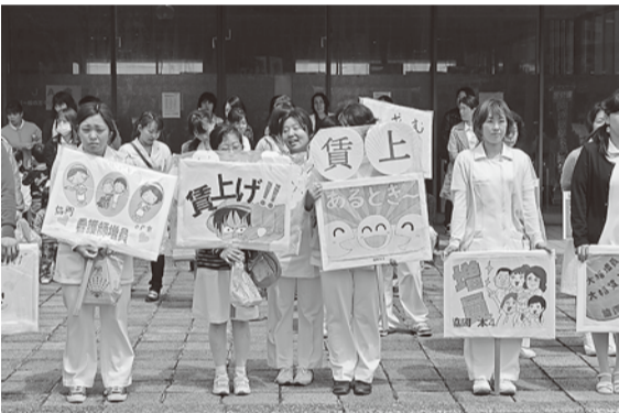
自慢のプラカードで景品狙う

桜の時期に20年以上続けている広厚労の白衣デモが4月7日に行われました。子どもたちも含めて130名が参加。バルーンや鯉のぼりなどのグッズや職場毎に作成した手製のプラカードを持って出発しました。 出発時点でパラパラと小雨が降ったものの、皆さんの思いが通じたのか雨はすぐに止んでくれました。市役所から商店街を抜けて尾道駅前までのコースで、お店の方や通行人にチラシを手渡ししながら「地域医療守ろう」「夜勤を減らして」とアピール。駅前では職場毎に分かれて「増員署名」を集めました。観光客等に声をかけ、署名をしてくれ