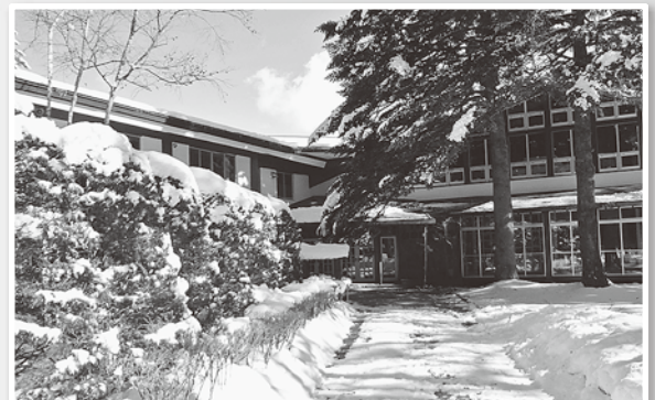
中央工学校 軽井沢研修所(写真は3月のもの)