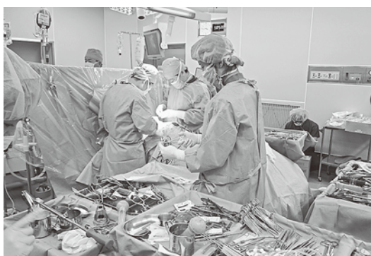
1分1秒をあらそう緊張感ある手術風景

手術室看護の魅力といっても、なかなか理想には届かないといえます。毎日が作業的な手術室となっている現状がありますが、手術室においても根拠に基づく看護実践が求められています。また、病院によっては、器械出しは、看護職でなく他職種が行う例もあります。全体的なマネジメントを行い、手術室に看護師が存在する意義を考えていく段階に進みたいと考えています。