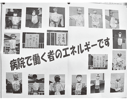
秋田・湖東総合病院の存続を求める住民手作りの看板や案山子

秋田からは、湖東総合病院廃止検討の報道から2年半、病院存続に向けた住民や自治体と一体になって取り組み、2年後に新築開設となったと報告がありました。地域住民の切実な声は板看板やかかし(写真、横断幕などでアピールされ、「住民の命がつといやシンポ、厚生連との懇談などの多様な活動を続けるなかで達成できた」と強調されました。栃木からは、下都賀総合病院と民間病院、医師会病