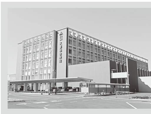
09001の取得へ向け、業務マニアルの整備など、準備を進めています。

埼玉県東部の久喜市にある急性期の高度医療を担う地域中核病院。平成23年4月に幸手市から久喜市へ移転した。300床の施設を現在202床で運用中です。久喜市を含む利根保健医療圏では、電子カルテを結んで、地域医療ネットワークシステム「とねっと」が7月から稼働しおり、「かかりつけ医カード」の提示で、圏内の医療機関で医療情報の共有が出来るようになっています。