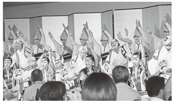
見事な踊りをみせていただいた「娯茶平連」の方々

10月~12月を「看護職場改善・労基法違反一掃月間」として設定し、看護職を中心とした労働条件改善と全職種での労基法違反一掃を通して、「働きがいのある働きやすい職場づくり」をすすめることが確認されました。