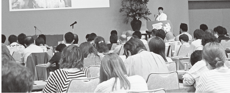
被災者支援活動など、取り組みや課題を特別報告(福島)

全厚労は9月14、15日の2日間、徳島市の徳島グランヴィリオホテルにて、第60回定期大会を開催。20県から代議員・役員・傍聴など210名が参加して、1年間の活動総括と12年度の運動方針について討議・決定しました。