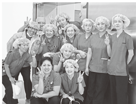
結束の強いスタッフのみなさん

今回のおしごと探検隊は、「手術室看護」を取り上げます。医療における最大職種である看護職。その中でも、手術室は、専門特化したイメージがあります。手術室での看護の役割・魅力は何でしょうか。開設から1年4カ月の埼玉県厚生連・久喜総合病院の手術室を訪問しました。