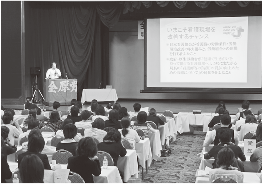
いまこそ看護現場を変えるチャンス、と訴えた

全国労働組合連合会 厚生連 〒110-0013 東京都台東区入谷1-9-5 TEL 03-3874-3591 FAX 03-3874-3593 発行日 毎月20日 定価 30円