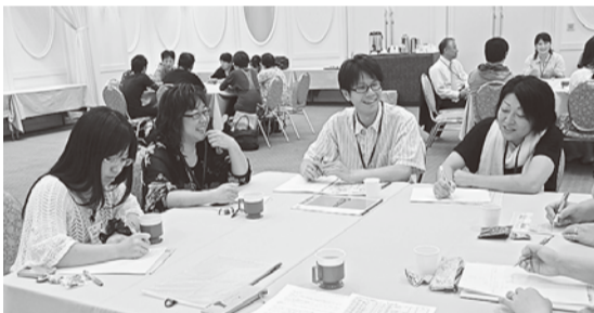
各地の実態や経験交流しながら働き続けられる職場を考えた

特別報告として2県の取り組みを紹介。ひとつは新潟が作成した「夜勤協定のたたかい」を学ぶDVDと昨今秋と今年の夏にも行っている「サービスクラス」改善月間について、時間外申請率を上げてきたことを報告してもらいました。DVDでは、44年前に民間病院で初めて「夜勤協定」を獲得した新厚労のたたかいの歴史とともに、現在、科学的知見として明らかになっている「夜勤の有害性」の問題や、各病院の看護委員の意見込みなどが紹介されました。