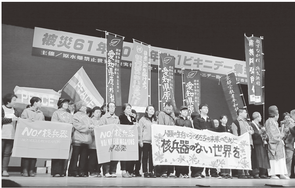
各地での取り組みを報告する参加者たち (3月1日)