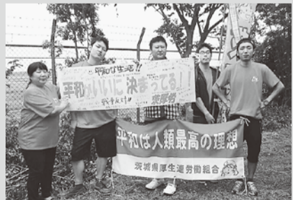
おそろいのTシャツで参加のなめがた支部

茨城では6月30日(木)から7月13日(水)にかけて行われ、茨厚労から6支部22名が参加しました。各支部でお揃いのピンクのTシャツを着たり、今年発足の平和委員会が作成した「平和は人類最高の理想」と書かれた横断幕や、参加できない職員を思いを寄せ書きした横断幕ともに行進しました。