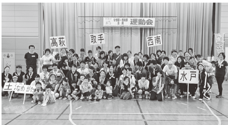
各支部から沢山の参加、笑顔でピース

ムの一体感が増していきます。運動会といっても、参加者の年齢は0歳から60歳までと幅広く、ケガなく！楽しく！出来る種目を女性部で考案。例えば、バトンの代わりに大きなスカートを着いて、スキップしながら次の走者にリレーしていくその名も「スカートスキップリレー」。男