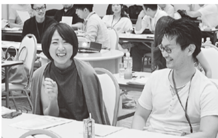
「隣の人と話しましょう」と自己紹介で話がはずむ

初日の講義で学んだ重要用語を利用したビンゴゲームを行いました。1番にビンゴした班には、最低賃金1000円以上要求TシャツとTPOP NO!Tシャツが贈られました。とっても素敵なTシャツだったので今後の着回しが気になります。