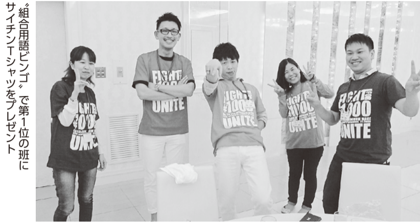
組合用語ビンゴで第1位の班にサイチンTシャツをプレゼント

第1講義「労働者の基本的な権利」では、「人間らしく働くルール」としての日本国憲法の条文や労働基準法の関わりについて講義していただきました。グループワークでは、休憩時間、労働時間、労働条件の不利益変更について事例を通して話し合いました。