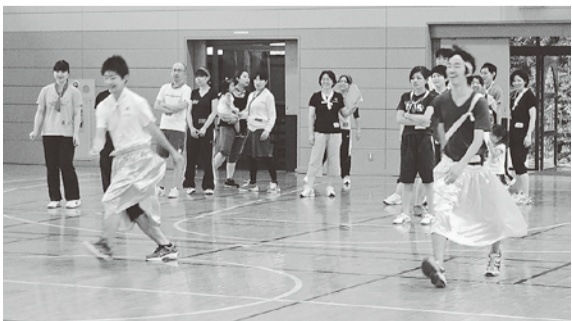
男女の垣根なし！スカートスキップリレー

3ヶ月の試用期間が終わるこの7月から組合加入となります。オーブン組合の茨厚労では、「数は力」「団結は何よりの武器」を合言葉に、常に仲間づくりを意識して新人加入にも積極的に取り組んでいます。今回の運動会もその1つ。チーム分けは支部対抗ではなく、病院、職場を越えて赤・白・黄の3チーム編成。競