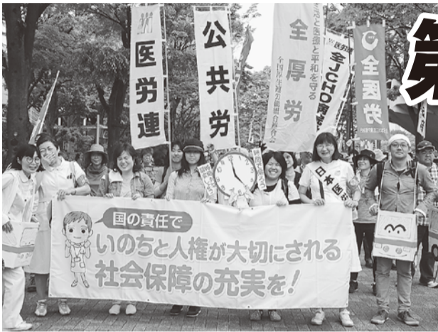
手作りの救急車を身にまといデモ行進 (中央メーデー)

5月1日、第88回メーデーが全国308カ所で開催され、約16万人が参加しました。日本国憲法の施行から70年目のメーデーは、戦争する国づくり、財界中心の政治に対し、憲法を活かして、平和と民主主義、人間らしく生き続けられる社会の実現を目指す決意を固める集会となりました。