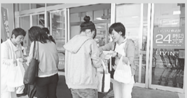
福島・雨に負けず署名を呼びかけました

福島では、郡山市ショッピングモールで大幅増員と処遇改善の国会請願署名に25名が参加。雨が降りしきるなか店頭での署名活動は大変でしたが、看護師や保育士になりたいと言う高校生達も署名してくれたり、白衣姿での署名には足を止めてくれる人が多く今年も元気の活動となりました。