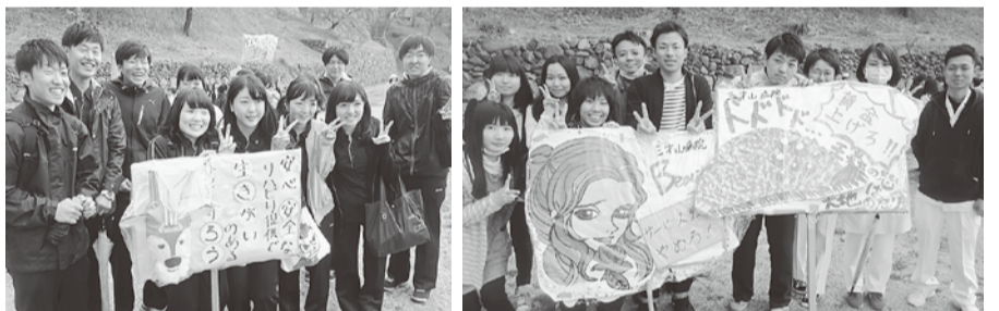
金賞に輝いた長厚労リハセンター支部のプラカードは、全て手書きが金賞の決め手

水戸・つくば・鹿行地域のメーデー集会に各支部から参加。土浦支部は、救護班も担当しました。会場では、茨厚労の16秋闘に対する支援への感謝と共に地域医療・地域社会を守り発展させるために運動を進めていこうと呼びかけました。中央メーデー決議には、「今年県内の春闘では、茨城県厚生連の病院での医師や看護師の賃下げ、労働条件の切り下げが大きな問題となりました。これまでも12月の一時金は2ヶ月出ているものが0.5ヶ月とし、退職金の積み増しを凍結するという提案がされました。この問題は、病院で働く労働者だけの問題ではなく、地域医療と健全な地域社会の存続にとっても非常に重要であるということも再確認