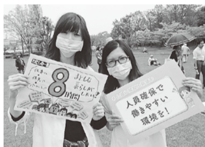
プラカードで8時間労働を主張!(水戸支部)

労働者だけの問題ではなく、地域医療と健全な地域社会の存続にとっても非常に重要であるということも再確認