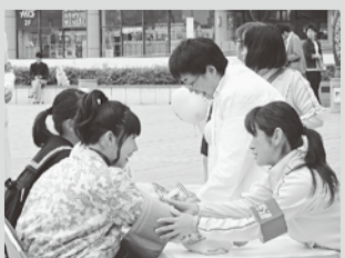
茨城・街中での血圧測定

茨城では「2017ナースウエーブinいばらき」を開催し、20名が参加。これまでのナースウエーブを振り返った後、水戸駅に移動し、血圧測定と健康相談と共に、白衣署名を行い、新夜勤改善署名は63筆、介護改善署名は56筆を集めました。