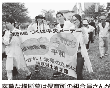
素敵な横断幕は保育所の組合員さんが一日で仕上げました!(土浦支部)

認しました」という内容が盛り込まれました。労働組合の役割は、労働条件向上だけでなく、社会全体に責任を持つことであると改めて感じたメーデー集会となりました。