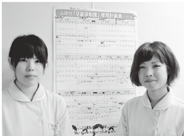
山口「9連休制度」導入当初の様子(2011年度)

例えば、山口で協定された「9連休制度」。年休5日とともに前後に公休2日ずつをセットにして、9日間を計画休暇として、誰もが休める制度にしたものです。交替制勤務である看護師さんらはほとんどが取得する制度として、他県にも広がりました。