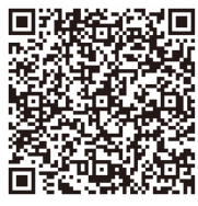
ハラスメント防止ポスター

調理部門の賃金引き上げも継続した課題です。昨年度各500円を引き上げさせましたが、今年も調理業務に携わる職員の特殊勤務手当の増額で、有資格者・無資格者ともども、1000円ずつアップさせること