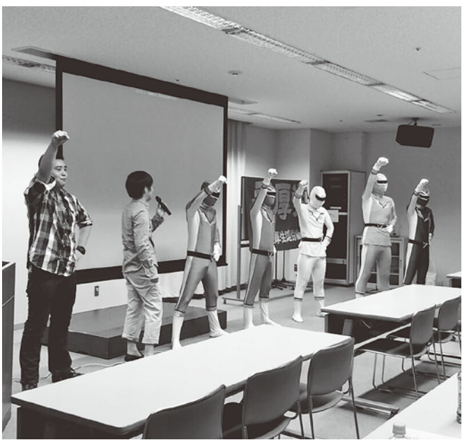
新歓での寸劇「職場を守る労組レンジャー」

香川では、これまで職員はインフルエンザ等の感染症に罹っても自分の有給休暇を使用し、仕事を休まなければいけない