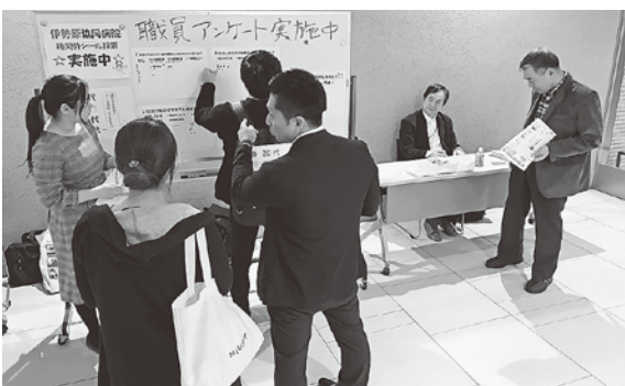
多くの職員がシール投票に快く応じてくれました（19年11月26日）

ができました。また6月からは、「ハラスメント防止措置」の義務化が始まりましたが、パワハラ裁判にも取り組んだ中で、会の方針を正し、「ハラスメント防止宣言文」を出させ、各部署に掲示させることになりました（QRコード読み取りで見られます）。 パワハラ裁判では、パワハラが一部認められ被告に賠償金支払い命令が出された。勝訴判決となりました。全厚労はじめ各県労組からの長期にわたるご支援に感謝申し上げます。 20春闘では、新型コロナウイルスの影響で、なかなか通常の活動が出来ませんでした。例年取り組んでいる「春闘朝ピラ」（写真）は、最初の方ですが、配布しました。早くコロナが収束し、いつもの労組活動ができるよう願っています。 （福厚労 斎藤文字）