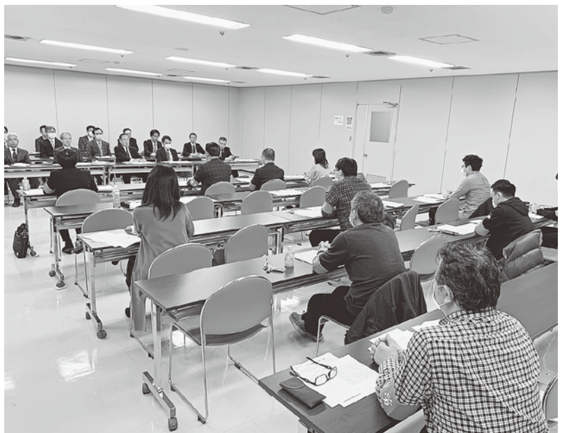
3密対策を万全に 経営分析を基に団体交渉

秋田県には県立病院がなく、厚生連が県立病院の役割を担っています。そのような中、自治体からの補助金の額が妥当な