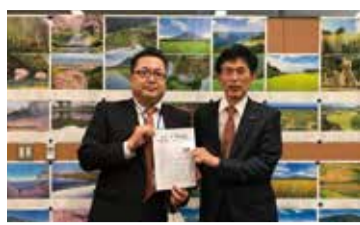
長野・篠原孝議員とポスター前で。