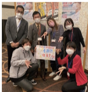
グループで達成目標アピール

職種別の専門部として看護委員会があります。「月6日以内夜勤」の実現や業務の負担軽減など看護師の「働き方改革」のために、日本看護協会との懇談や政府・厚生労働省との交渉も行っています。年に1度の大きな集会として、10月頃に「幹部・看護師集会」を開いています。22年10月には3年ぶりに秋田でハイブリッド集会を開催し、リアルにグループワークを行いました。