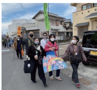
23ビキニデーの墓参行進

平和委員会は、平和な日本と世界を作るために自分たちが出来ることを考えて行動しています。コロナ禍の期間、職場に「ピースフラッグ」をリレーしてアピールする行動やバーチャルツアーを実施、ヒロシマ・ナガサキ・フクシマを二度と起こさないことを決意する「原水爆禁止世界大会」への参加、3月1日には、ビキニ水爆実験被災経験を継承する「ビキニデー」(静岡・焼津)にも多くの仲間を送り出して、平和の世論を上げています。