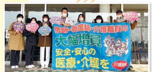
【長野】北信支部 大きな横断幕で増員アピール