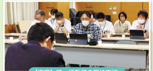
【広島】統一行動日の団体交渉

全員がワッペンをつけて春闘に取り組み、統一行動日の9日に団体交渉。賃金では、ベースアップ3千円（医師と地域職員を除く全職員）、年度末一時金一律7万円+評価料後払い分（看護師4万8千円、他職種7万2千円）の支給、令和5年度年間一時金4.5ヵ月、処遇改善手当も、医師を除く正職員と地域職員へ月7,000円支給を勝ち取りました。また諸要求では、夜勤日数について夜勤協定遵守（8日）に向けた要員確保に努め、月6日を将来目標に掲げること、有休は前年を上回る取得を目指すこと、JAおよび自治体への財政支援を引き続き行うことなどの回答を引き出しました。その他、電子データ管理の専門知識を持った者の配置なども確認しています。