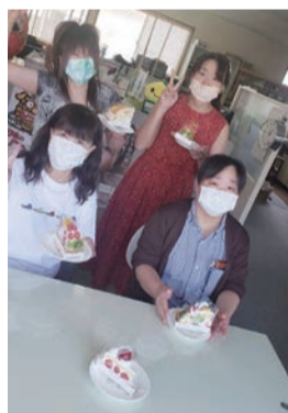
21年OL学習会でのスイーツ自慢

女性委員会は女性ならではの悩みや、「生理」「出産・育児」等に関わる課題を扱っています。毎年6～7月を「母性保護月間」として、女性の権利の啓発や取得に取り組みながらも、おいしいスイーツを食べたり、温泉のある場所で集会を開いたりなど、日頃のストレスを発散、リフレッシュする「楽しみ」も重視しています。昨年は集まれず「オンライン学習会」でしたが、今年の6月は「福島・スパリゾートハワイアンズ」を会場に集会を準備中です。