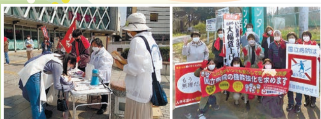
【茨城】左：水戸駅前署名39筆集める!! 右：霞ヶ浦医療センター