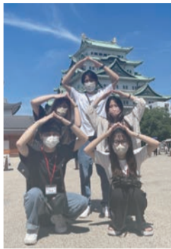
K's現地フォトコンの最優秀賞作品

20代から30代前半で活動している青年委員会は、2年に1回の「K's station(青年集会)」を企画運営、アクトインサマー(日本医労連の青年集会)への参加など、ココの繋がりを大切にしています。「交流(遊ぶ)」も遊びに繋がります。22年7月にはハイブリッドで「K's in なごや」を開き、2日目に名古屋城見学なども行いました。24年7月には金沢で開催予定です。