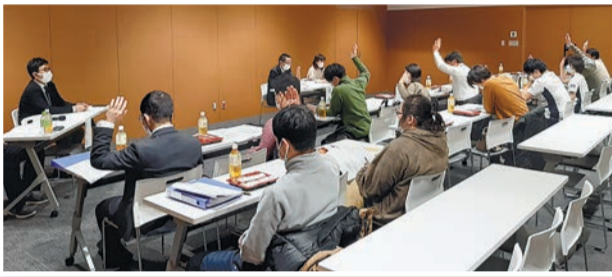
【愛知】中央委員会の様子