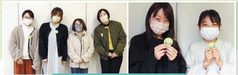
【広島】春闘ワッペンで団結をアピール