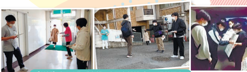
【茨城】左から取手支部・水戸支部朝ピラ・退勤調査

23春闘では全厚労の統一要求項目として「1. 相次ぐ物価高へ対応するため、実質賃金確保に見合う大幅賃上げを行うこと、2. 厚生連協同組合医療を守るために、労使協同での運動をさらに進めること」を掲げ、統一した運動を進めています。ワッペン行動は11県、スト権投票は12県が行っています。各県の取り組みや回答状況を紹介します。