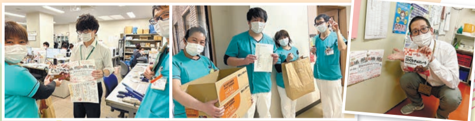
【茨城】西南支部ではチョコレートと一緒にピラ配布