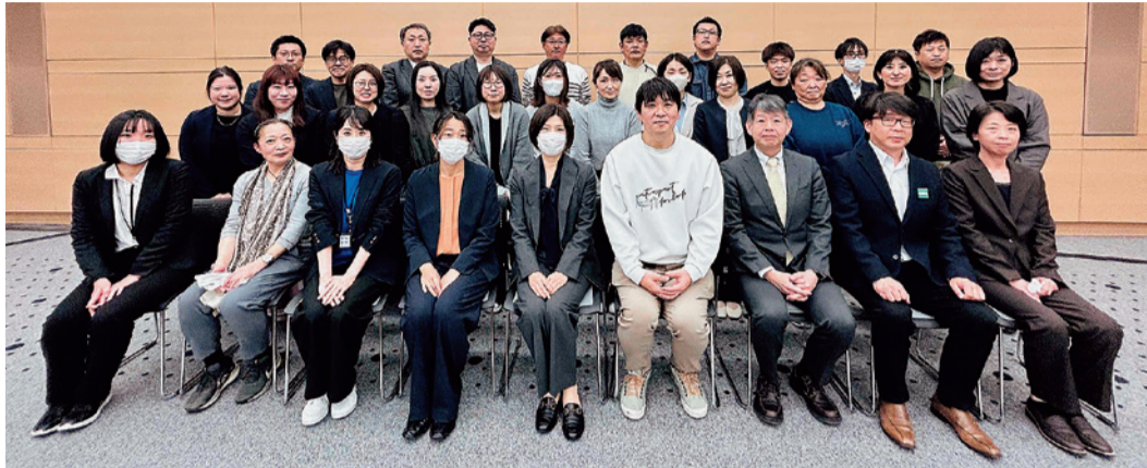
懇談の後に和やかな雰囲気

3月25日、全厚労看護委員会は日本看護協会ビルJNAホール（東京都渋谷区）にて日本看護協会と懇談を行いました。看護委員と各県からのオブ参加者を含め27名が参加。「人材確保・離職防止の取り組みと、看護職が働き続けられる環境の整備」のテーマで現場の実態を伝え看護協会の方針を伺いました。懇談の内容を紹介します。