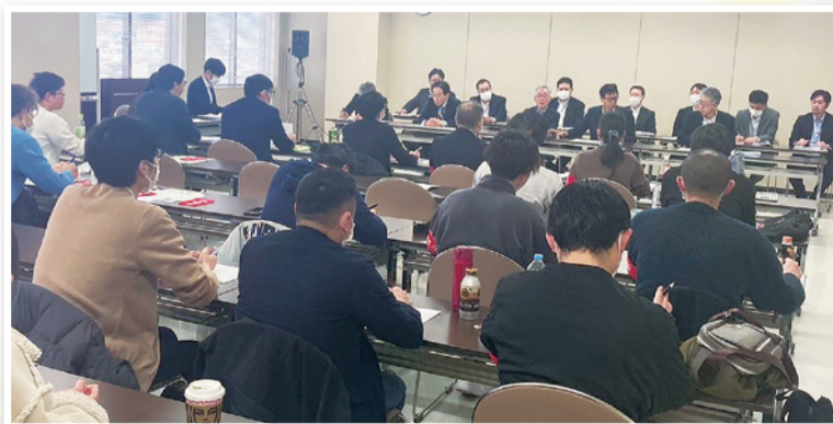
団交する秋厚労の仲間たち

秋厚労では、夜勤手当見直しによる規程改正が示されました。主な内容は、夜間看護手当を廃止し、準夜勤務手当・深夜勤務手当に合算、さらに各手当を五百円引き上げるものです。加えて、夜勤を月八回以上実施した職員には、交替制勤務従事者手当に三千円を加算するとされています。現場で働く職員を評価し、処遇改善につなげる前進として注目されます。