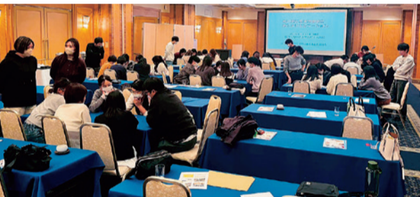
新人オリエンテーションのグループワーク

今年度、香厚労では10数名の新たな組合員を迎えられることができました。大規模なイベントなどを開催したわけではありませんが、組合員との「対話」を心掛け、一歩ずつ活動を積み重ねたことが今回の結果につながったと考えています。 最大の取り組みは、執行委員会における情報共有を徹底したこと。決定事項の報告にとどまらず、そこに至るまでの経緯や背景を丁寧に伝えることを心がけました。この姿勢が組合員に安心感を与え、日々の小さな悩みや不安を気軽に相談できる関係性が構築されました。 特に入職3年目までの職員は、日々の業務に精一杯で孤立しやすい傾向があり、26日以降は第2回団交の内容を伝えるとともに、ストライキ権投票の大切なことを支部四役で説明。また時間が取れる方については、その後も職場の声を聞き取りました。 夜勤協定の不履行に伴う仕事の忙しさが積み重なって辛い、人員補充がないことへの不安などの意見が出ました。また物価高なので賃金アップを切実に思っていること、定年延長は今後どうなりそうか、などの質問も出されました。 参加者の中には、日頃組合事務所に来たことがない方もたくさんおり、いつもは話しができない人からも貴重な意見を聞くことができました。医師やスタッフ間などのハラスメントや夜勤が増えて大変なこと、他、「病院からは赤字と聞くのに、そんなにもらって大丈夫なの?」という率直な意見もありました。それには組合としても経営状況を確認したり、経営の勉強をしたりして、可能な範囲で協議・妥結していることを説明し、理解してもらいました。 ここで集めた組合員の声を集約し、今後の組合の団結と交渉に活かしていきたいと思えます。 1月31日開催の新人オリエンテーションでは全厚労青年委員会の活動を参考に、親しみやすい企画を導入しました。あわせて四役や各専門委員が顔を出し、積極的に自己紹介を行うことで、心理的な距離を縮めました。その結果、現場で新人と声を掛け合う場面が増え、信頼関係の土台を作ることができました。 団体交渉においても、現場の労働環境や切実な悩みを可能な限り具体的にリアルな「生の声」として会側 今回の活動を通じた教訓は、「日常の活動の原点は「日常の対話」にあるということです。特別な行事以上に、現場の悩みに耳を傾け、その声を代弁する姿勢が新人や、組合加入を思い留まる職員への信頼を得ることに繋がったと考えています。 今後の課題は、この「寄り添う姿勢」を新体制の下で、より組織的に継続・強化していくことです。単なる加入数という数字を追うだけでなく、誰一人として取り残さない体制を構築し、全ての組合員が安心して働ける職場環境づくりに向けて、次年度も全力を尽くしていきます。