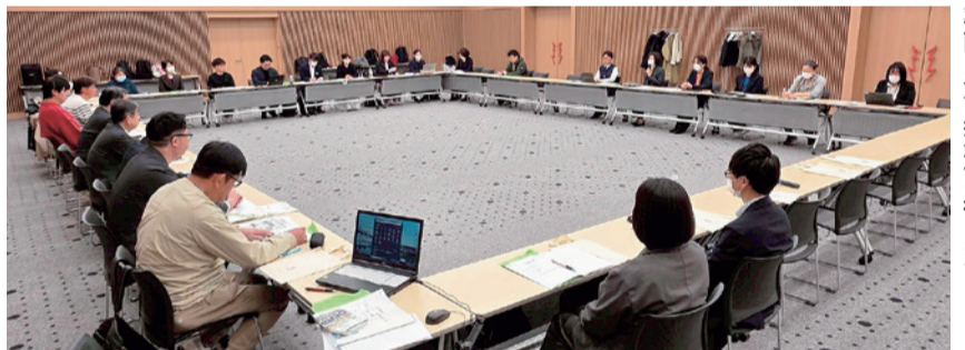
率直に意見交流を行った

秋厚労や高厚労からは、病棟再編で病床削減が進む中、子どもの減少で小児科を残すことが難しくなり、大人と同じ病棟に入れることでゾーニングをしてもスタッフへの負担となっている現状を伝えました。協会からは現場での教育体制の強化や、必要体制の構築を看護部で話すことが重要との認識を示しました。