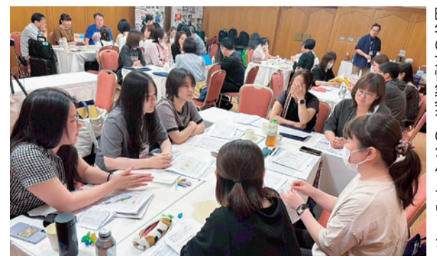
昨年の女性集会でのグループワーク

に眠らないと疲労が回復しないという結果が出た。普段の日勤中と比べたら、次の日またでしっかり寝ることが回復には有効とわかった。夜勤をしている人の休日数を増やすことも必要と考えている。そういうことができるように情報提供していきたいと、継続して夜勤に入っても、休日は日中に活動している事例を挙げました。