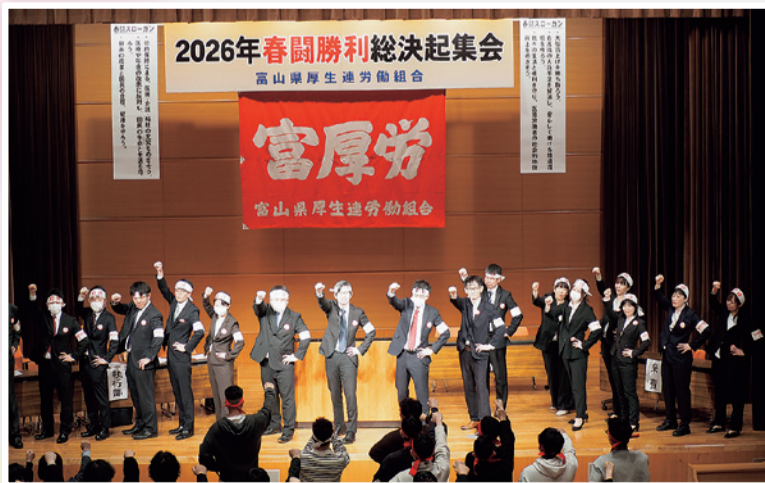
意気高らかに結束する組合員達

富厚労は4月4日に2026年春闘勝利総決起集会を参加者215名のもと開催し、各議決案、春闘スローガン、闘争宣言が採択され組合員団結をより強固なものにしました。春闘勝利に向けこの勢いのまま組合員全員一致団結して闘い抜く決意を固めました。