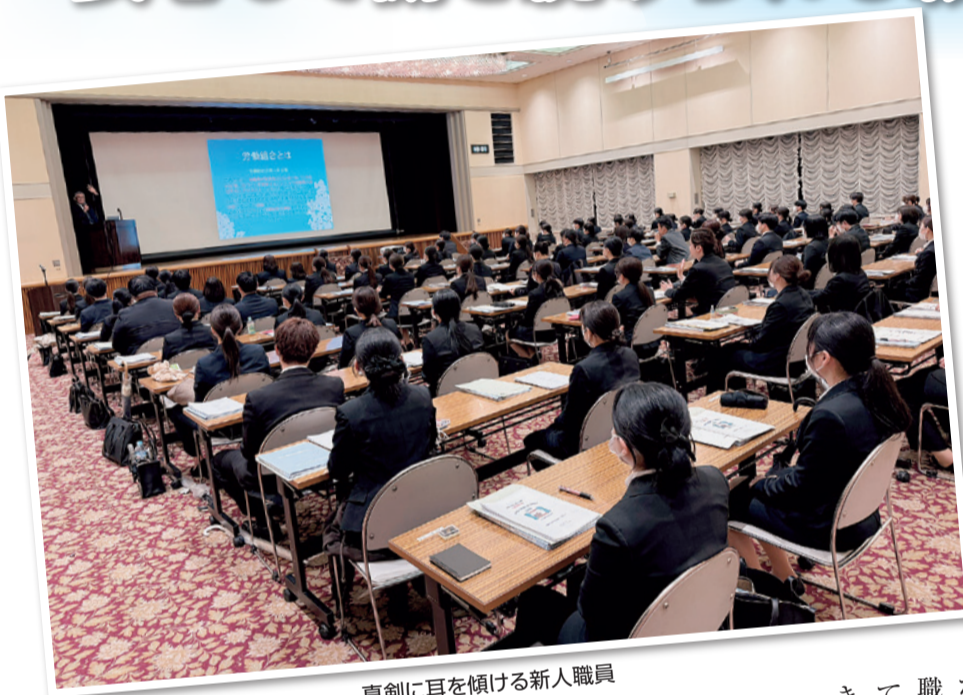
真剣に耳を傾ける新人職員

4月2日、広厚労は新人職員研修の場で組合説明会を行い、労働組合の役割や意義、仲間とつながることの大切さを新たに職場に入った職員へ伝えました。会場いっぱい集まった新人職員が真剣に耳を傾け、安心して働き続けられる職場づくりに向けた第一歩となりました。