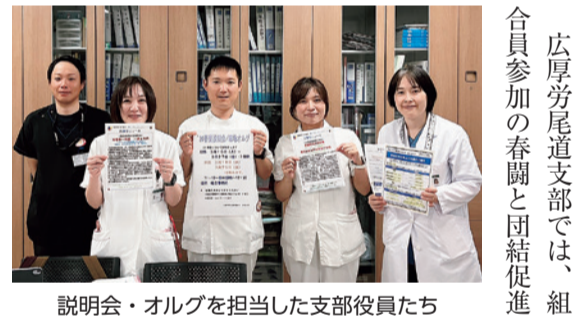
説明会・オルグを担当した支部役員たち

広厚労尾道支部では、組合員参加の春闘と団結促進のため、春闘説明会・職場オルグを行っています。 広厚労は3月6日に春闘要求提出、3月11日に回答指定日、3月12日に団体交渉を行いました。それらを踏まえ支部では16～27日(水曜日を除く7日間)の11～13時の昼休憩に説明会を開催し、参加者にはクオカードを渡しています。一日に20～40名程度、延べ180名が参加しました。 3月12日の第1回団交、26日以降は第2回団交の内容を伝えるとともに、ストライキ権投票の大切なことを支部四役で説明。また時間が取れる方については、その後も職場の声を聞き取りました。 夜勤協定の不履行に伴う仕事の忙しさが積み重なって辛い、人員補充がないことへの不安などの意見が出ました。また物価高なので賃金アップを切実に思っていること、定年延長は今後どうなりそうか、などの質問も出されました。 参加者の中には、日頃組合事務所に来たことがない方もたくさんおり、いつもは話しができない人からも貴重な意見を聞くことができました。医師やスタッフ間などのハラスメントや夜勤が増えて大変なこと、他、「病院からは赤字と聞くのに、そんなにもらって大丈夫なの?」という率直な意見もありました。それには組合としても経営状況を確認したり、経営の勉強をしたりして、可能な範囲で協議・妥結していることを説明し、理解してもらいました。 ここで集めた組合員の声を集約し、今後の組合の団結と交渉に活かしていきたいと思えます。