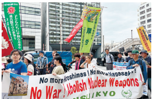
東京・江東区をパレードする参加者ら

参加者らは、時折強い風の吹く中、夢の島から新橋まで、「ピースコール」や「ヒロシマのある国で」を唱和しながら、パレードしました。