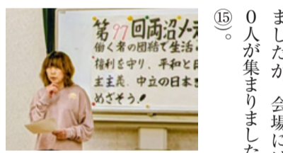
⑮0人が集まりました（写真⑭）