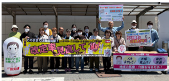
⑤横断幕がカラフルで目立ちます☆