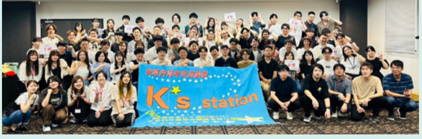
前回K's(金沢.2024)での集合写真

スローガン 来るだけで大吉 三重K'sにおかない 日時 7月3日(金)14:00~5日(日)12:00 場所 三重県鳥羽市・鳥羽シーサイドホテル