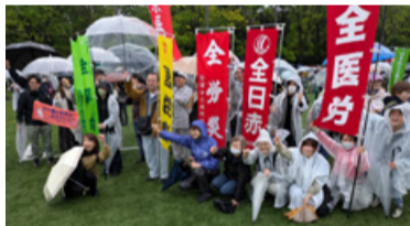
⑪両沼地区メーデー