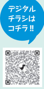
デジタルチラシはコチラ!!

組合役員の次世代育成や、青年層組合員の活性化などを目的に、各県から積極的なご参加をお願いします。※詳細は各県労組迄ご連絡ください