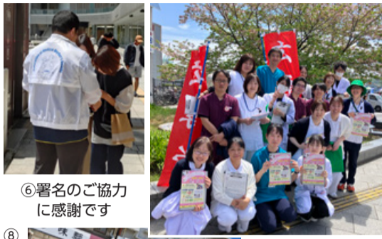
⑥署名のご協力に感謝です