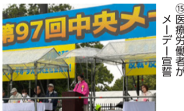
⑮医療労働者がメーデー宣誓