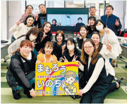
全厚労女性委員会にて (4月13日)

政府はナフサの代替調達や備蓄の活用により、「日本全体で必要量は確保できており、供給不足の懸念はない」との見解を一貫して示しています。しかし、厚生連の医療資材等の共同購入を行っている日本文化連では、「物流の滞り、卸・メーカーの在庫状況の差から、出荷制限や調整は様々