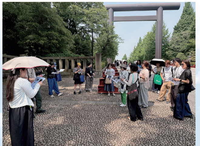
大鳥居の手前で、創建の歴史や戦争との関わりを学ぶ参加者