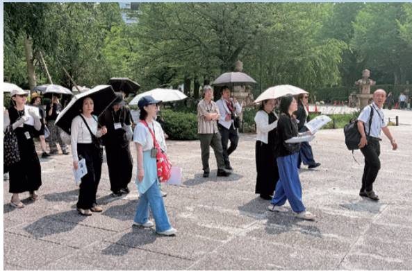
真夏を思わせる暑さの中を歩く