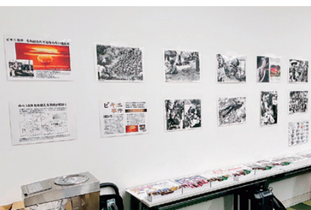
会場後方では原爆パネル展示も行いました