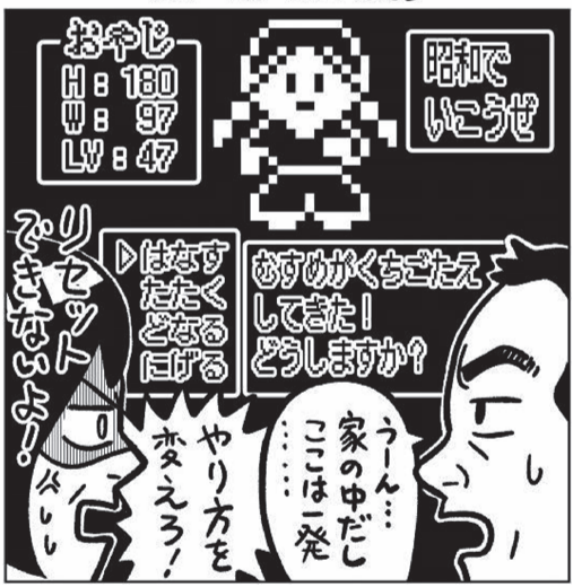
どんな場でも暴力に断固NO!