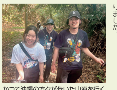
かつて沖縄の方々が歩いた山道に行く